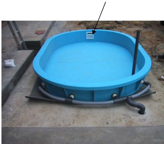
UIS-FC fölös beépítése PP vagy