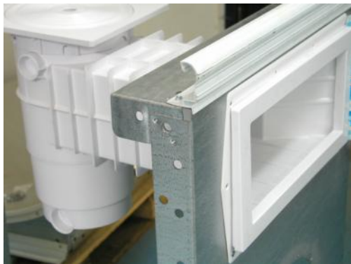
UIS-SOLEO fölös beépítése SOLEO medencébe