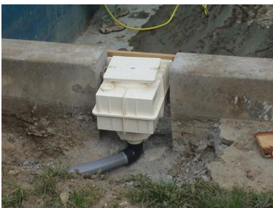
UIS-1/UIS-BC fölös beépítése csempézett betonmedencébe