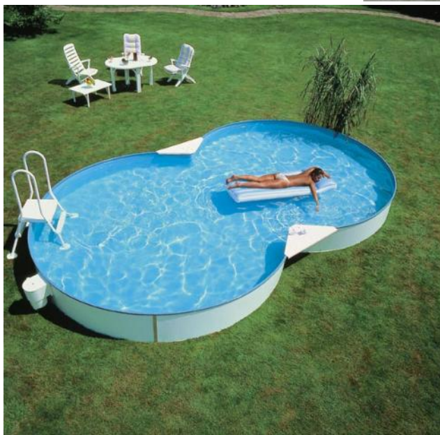
UIS-WK2000 fölös beépítése EUROPOOL medencébe