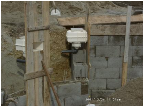
UIS-11/UIS-FC fölös beépítése fóliázott betonmedencébe

Az eltér medence típusokba általában eltér fölös ket kell beépíteni az alábbi, alap fölös típusokat bemutató rajzok szerint: